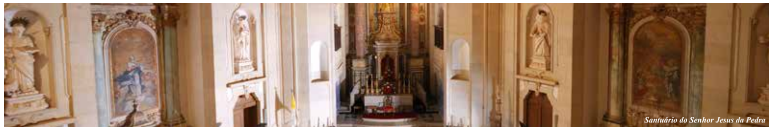
Santuário do Senhor Jesus da Pedra

*Acompanhamento musical durante as cerimónias religiosas por: Grupo Coral e Instrumental do concelho de Óbidos - Alma Nova Banda da Sociedade Recreativa e Musical Obidense Sociedade Filarmónica e Recreativa Gaeirense